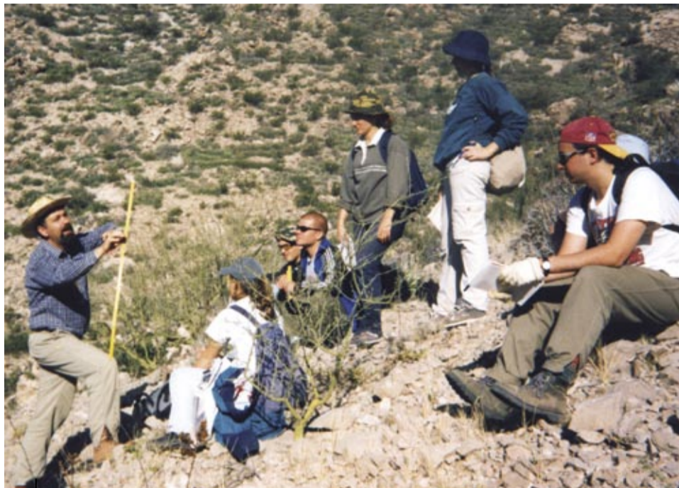
Estudiantes de Geología y profesor en el cerro La Silla de San Juan.

El permanente desarrollo tecnológico que demandan tanto las ciencias como la economía han convertido a ciertas disciplinas en resortes fundamentales para su progreso: la matemática, la química, la física y la biología o la geología, desde sus más variados aportes -a veces sirviendo de base científica para la innovación en tecnología y otras veces combinándose para resolver las consecuencias ecológicas de la misma-, son áreas para las cuales, en la UNLPam, se forman profesionales altamente calificados.