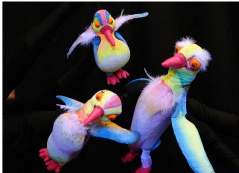
Los títeres del Teatro Negro de Bulgaria fascinaron al público del Aula Magna.

Las carreras artísticas tienen mucha demanda en su país y condiciones de ingreso sumamente estrictas. "Cuando me inscribí en la universidad, éramos tres mil chicas y sólo había siete lugares", recuerda. El plan de estudios, en cuatro años, desarrolla contenidos vinculados a la historia del arte, la interpretación, expresión oral, danza, dirección, adaptación de tex-