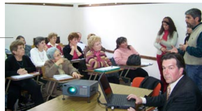
Presentación del Taller Jurídico-Contable para Adultos Mayores.

Los resultados de las primeras evaluaciones demuestran que, entre Santa Rosa y General Pico, unas 230 personas de entre 50 y 86 años se sumaron a las propuestas de los talleres.